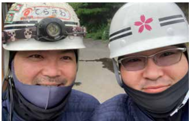
▲左：寺澤常務 右：千葉専務

設立年：2012年4月 年商：608,257,000円 ※2020年3月決算時点