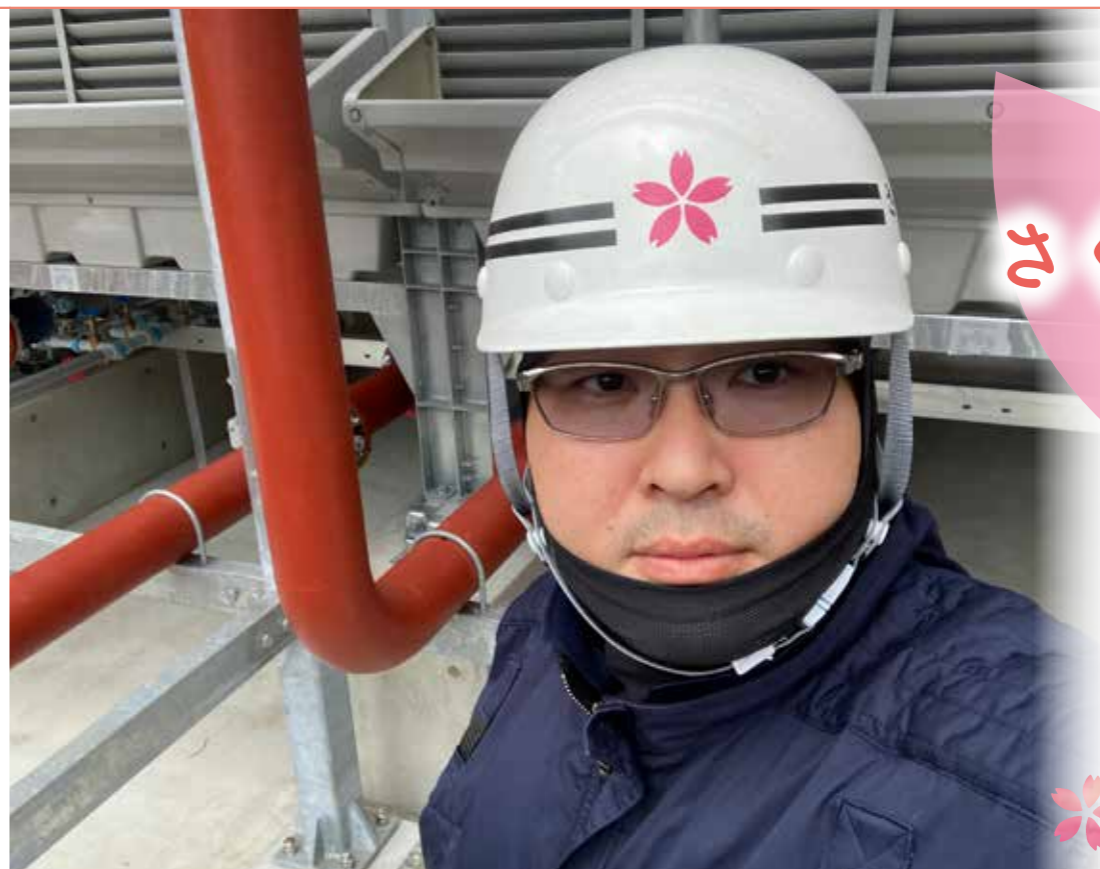
配管施工部 取締役 専務